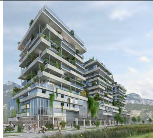
Illustration d'ambiance - image non contractuelle