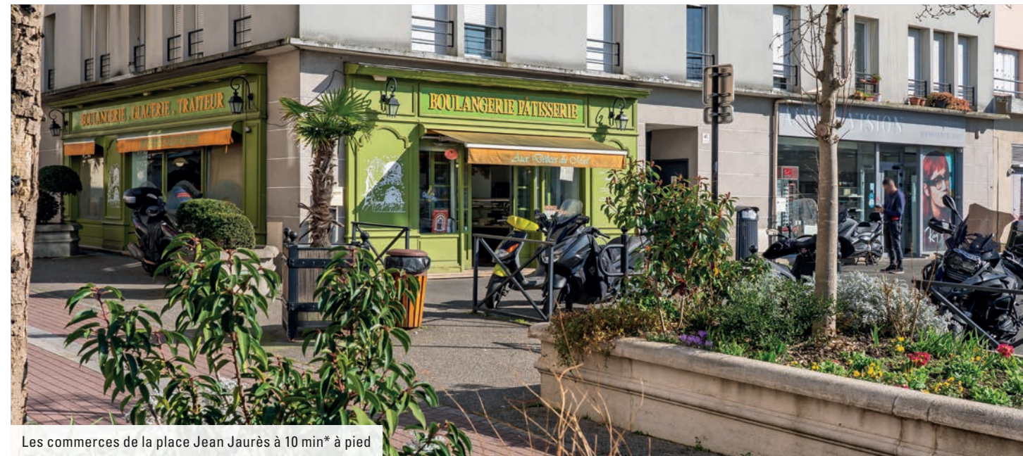
Les commerces de la place Jean Jaurès à 10 min* à pied

La ville séduit aussi les actifs grâce à sa proximité avec l'aéroport d'Orly, le Marché International de Rungis et le CHU Henri Mondor. Tous les déplacements sont facilités par un accès rapide à l'A86, mais aussi par les transports : RER A et D ainsi que le métro 8 à 10 min* de la résidence.