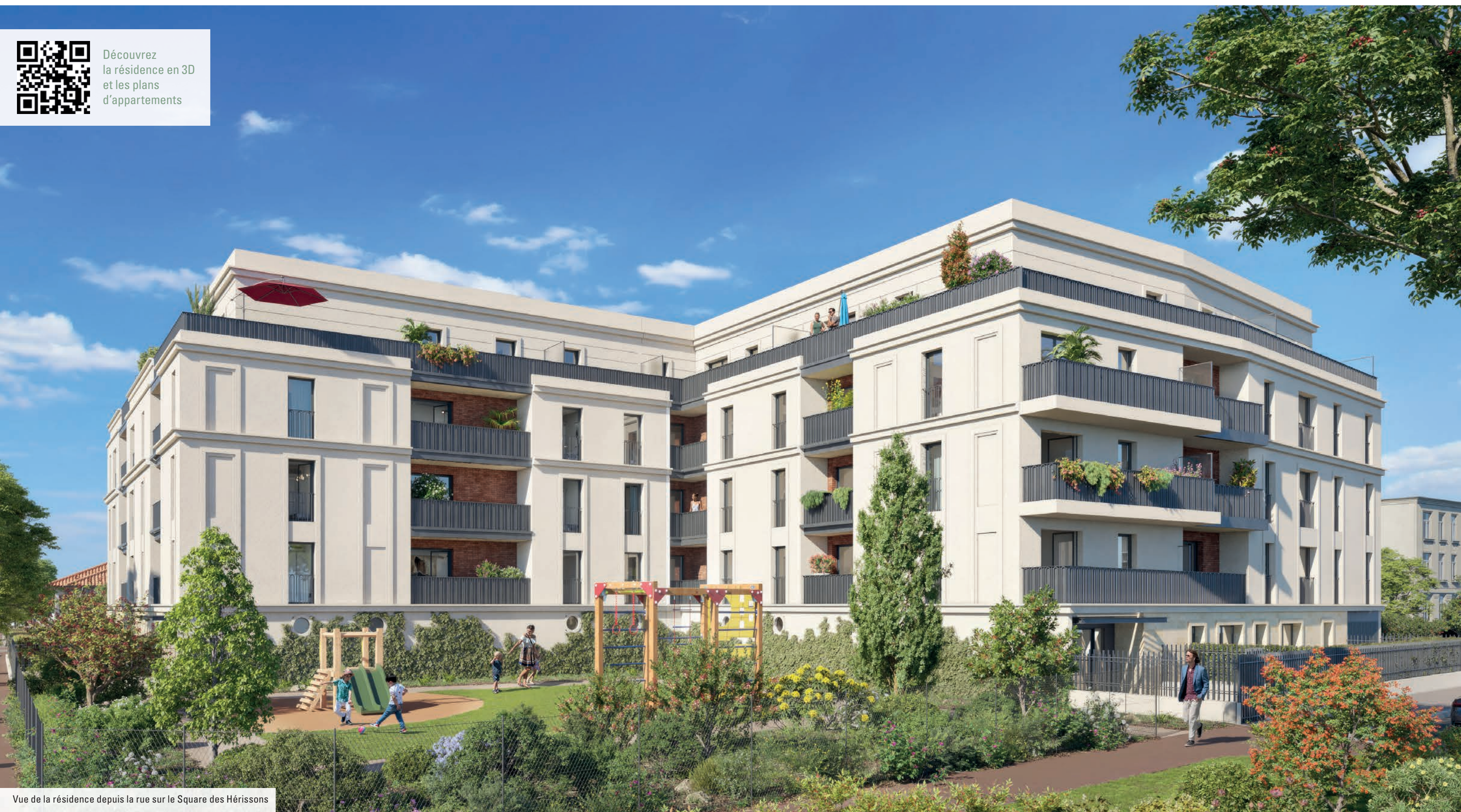
Vue de la résidence depuis la rue sur le Square des Hérissons

Découvrez la résidence en 3D et les plans d'appartements