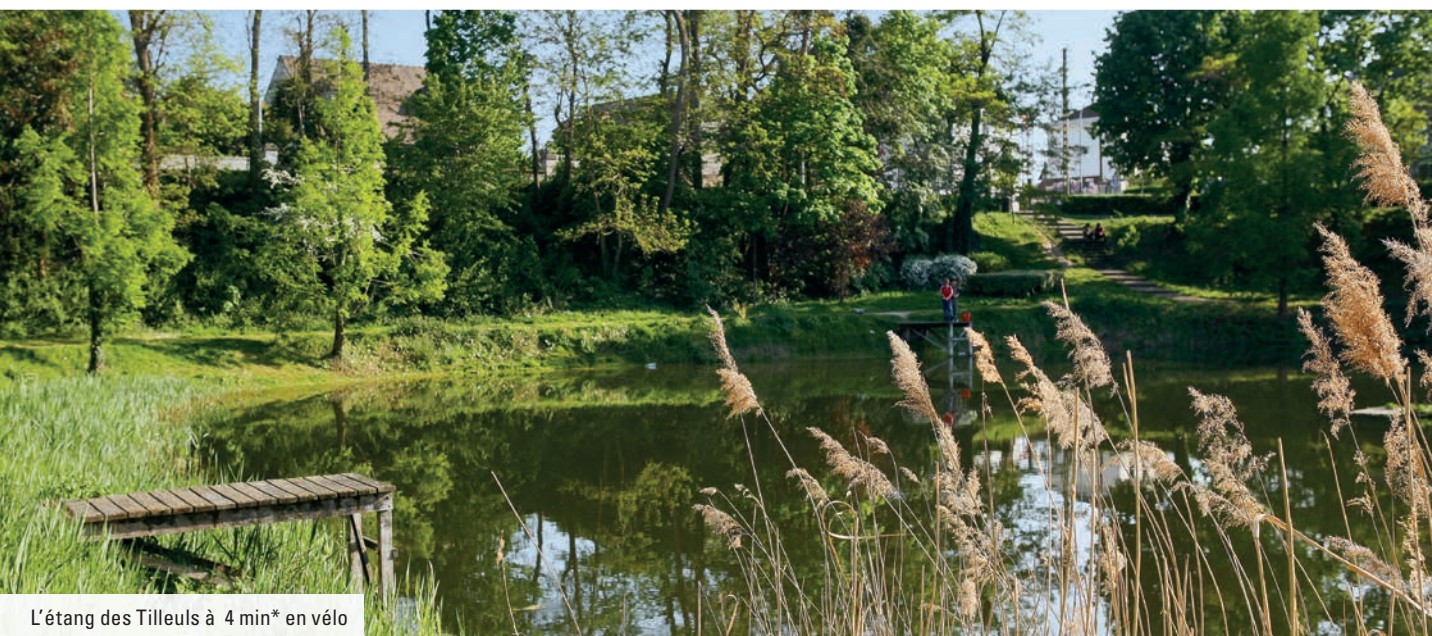
L'étang des Tilleuls à 4 min* en vélo