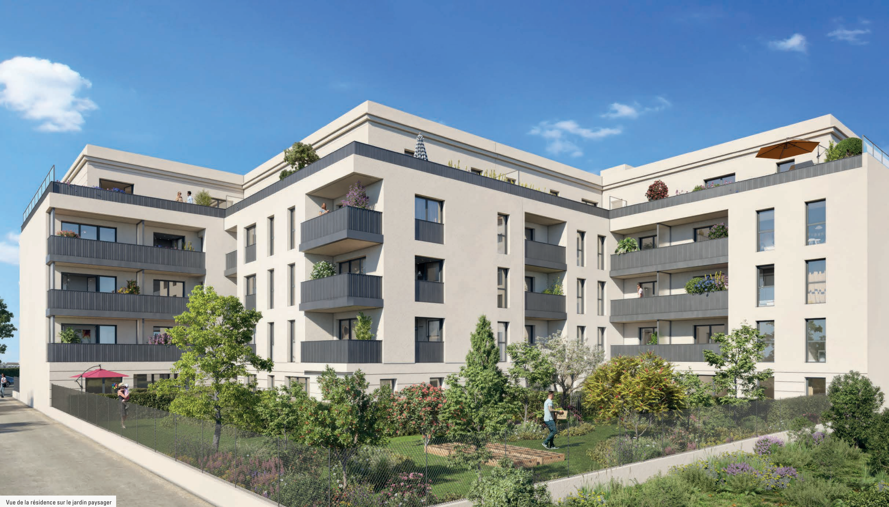
Vue de la résidence sur le jardin paysager