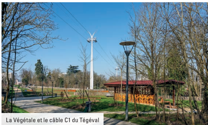
La Végétale et le câble C1 du Tégéval