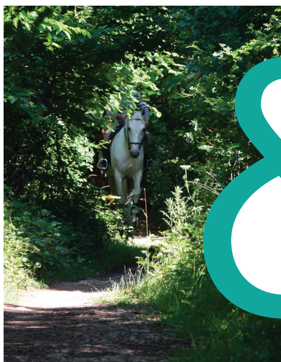
Forêt de Haye