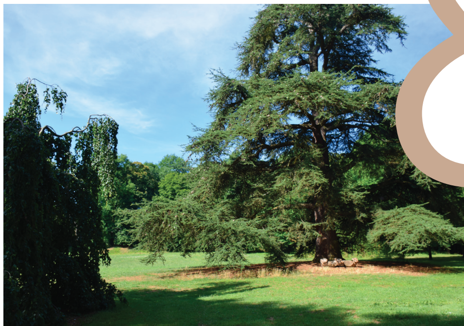
Parc de Rémicourt