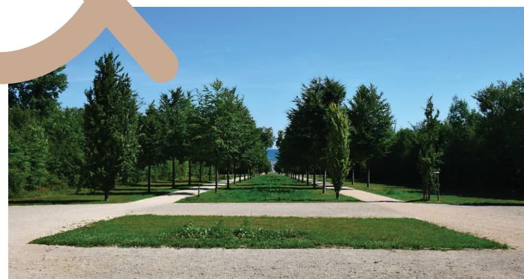
Parc de Brabois