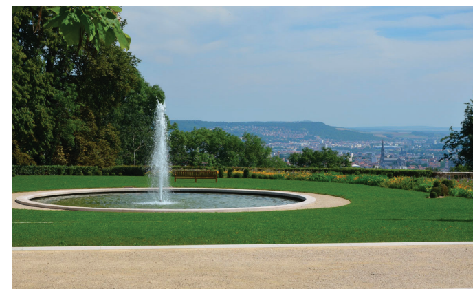
Parc de Brabois

Parfaitement intégrée au réseau de transports de la Métropole du Grand Nancy , Villers-lès-Nancy est naturellement la commune de prédilection pour ceux qui souhaitent vivre au vert tout en restant connecté à l'ensemble de l'agglomération.