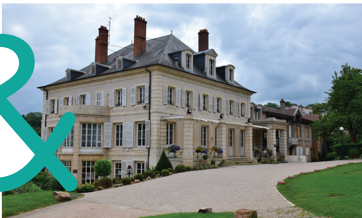
Château de Graffigny

Sur les hauteurs de Nancy , la réputation de Villers-lès-Nancy n'est plus à faire. Connue comme la ville aux 7 châteaux , reconnue pour son jardin botanique, le parc du Brabois ou encore la forêt de Haye, la ville est l'une des plus prisées de la métropole nancéienne. Hormis son patrimoine historique et naturel exceptionnel, Villers-lès-Nancy dispose de nombreux atouts. Ses équipements scolaires de qualité, de la crèche au lycée, sont très appréciés des familles et, avec la proximité des facultés, de l'hôpital universitaire et des grandes écoles, elle séduit de nombreux étudiants.