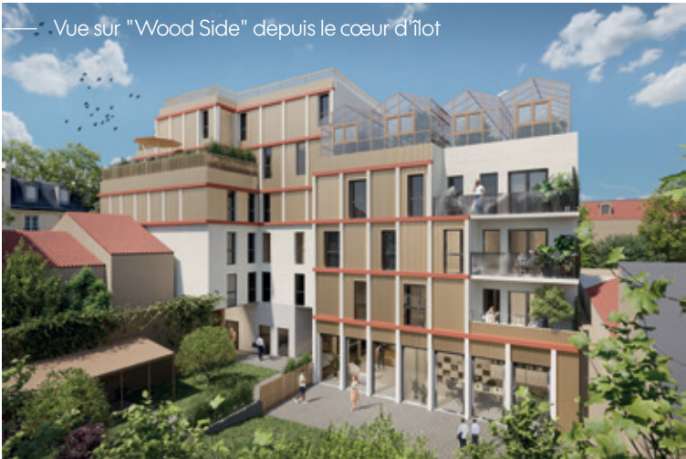
Illustration à la libre interprétation de l'artiste.

À 600 m de la ligne 9, desservant rapidement le Grand Paris