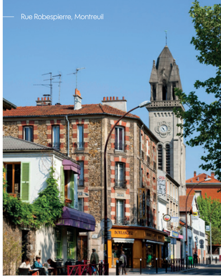
Rue Robespierre, Montreuil

Entre les métros Robespierre et Croix-de-Chavaux, "Wood Side" est situé dans un secteur animé limitrophe de Vincennes. Son cadre privilégié, à 300 m de la très commerçante rue de Paris, offre toutes les commodités et une excellente desserte par les transports en commun.