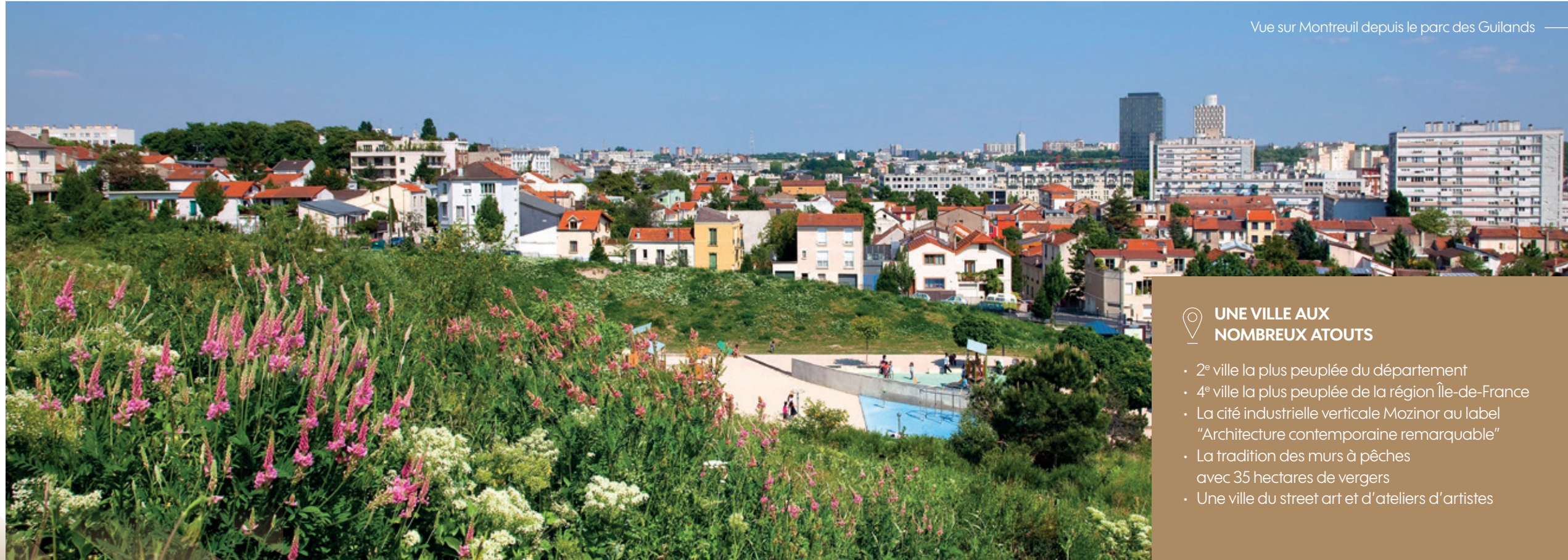
Vue sur Montreuil depuis le parc des Guilands