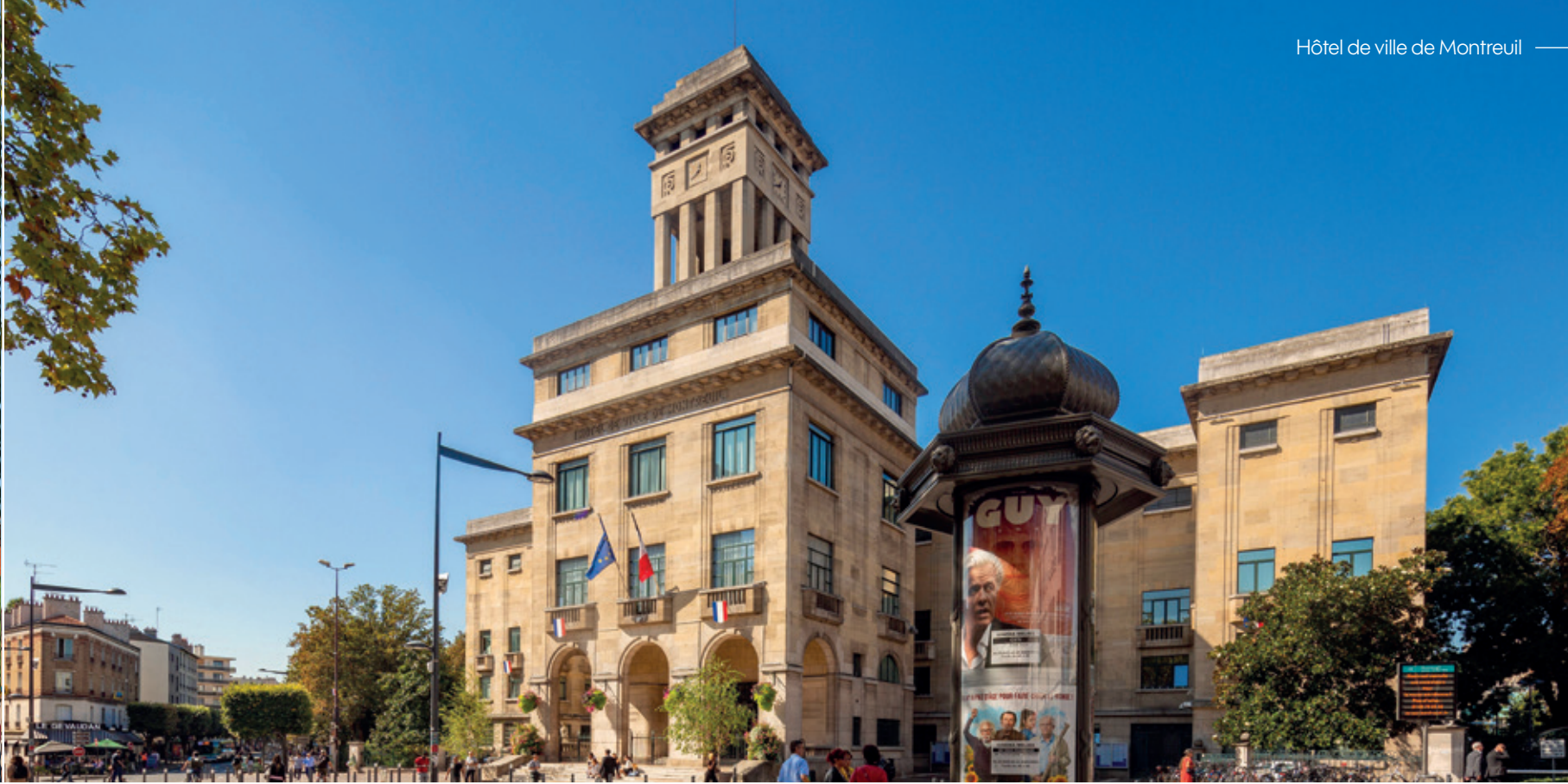
Hôtel de ville de Montreuil