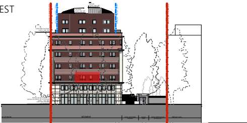
FAÇADE NORD OUEST